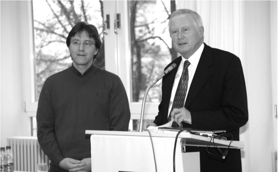
Auf der KRGB-Diözesantagung München und Freising 2011